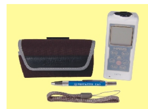
CA 770 - ukończenie